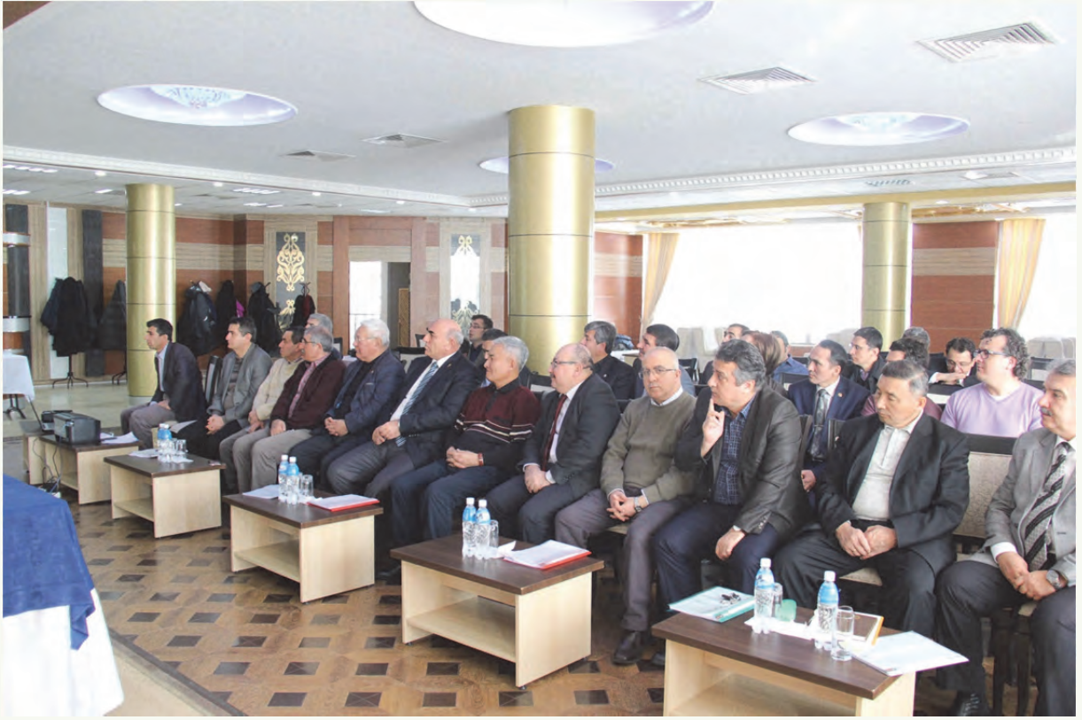
Tablo 2. II. arama konferansı çalışma grup ve katılımcı