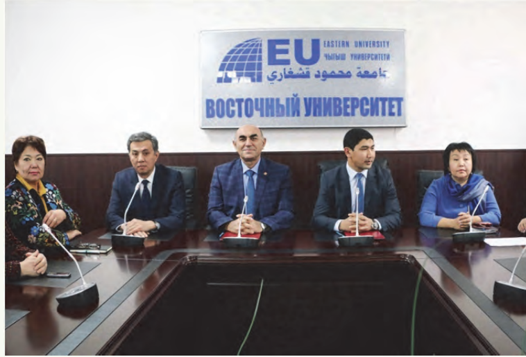
Tablo 16. İşbirliği protokolleri imzalanmış ülkeler

Bu amaçla, Türkiye'den 80 üniversite, kurum, kuruluş ve STK ile Türkiye dışından ise 68 yüksek öğretim kurumu ile işbirliği Protokolleri imzalananarak (Tablo 16) öğrenci ve öğretim elemanı değişimine, staj ve öğretim elemanlarının gelişimine, ortak bilimsel, sosyal ve kültürel faaliyetleri ile ortak projeler geliştirilmesine yönelik çalışmalara etkin bir şekilde başlanmıştır.