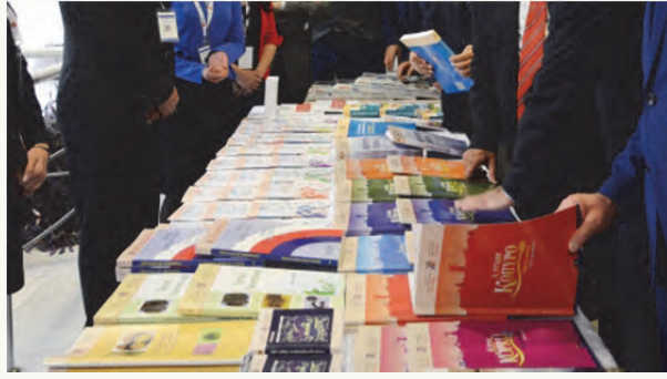
Tablo 13. Yayın sayıları

KTMÜ öğretim elemanları tarafından hazırlanan bilimsel yayın sayılarının 2010-2015 yılları arasındaki beş yıllık dönemde sürekli artış göstermektedir. Özellikle uluslararası yayın sayısında artışın büyük oranda gerçekleştiği görülmektedir. Bu yayınlar en çok 2013-2014 eğitim-öğretim yılında yapılmıştır. Üniversite öğretim üyeleri tarafından yapılan uluslararası bildiri sayısında da önemli artışları olmuştur.