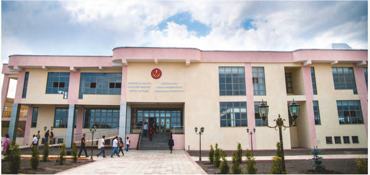
Tablo 7. Yemekhaneler, Kantinler, Kütüphane ve Okuma Salonları