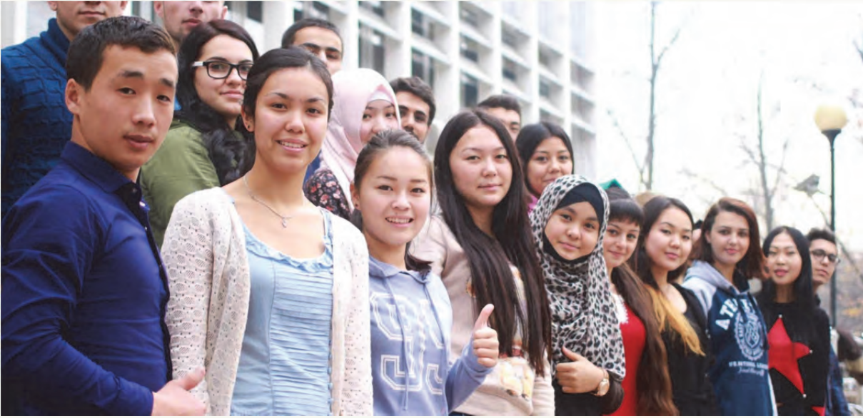
Tablo 11. Akademik birimlere göre lisansüstü öğrenci sayıları