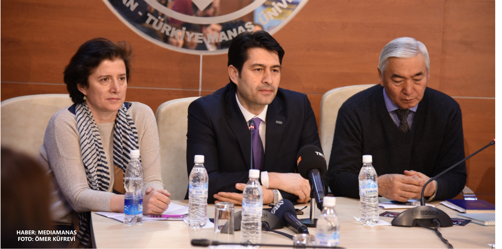
HABER: MEDIAMANAS

Türk İşbirliği ve Koordinasyon Ajansı (TİKA) ile Türkiye Radyo Televizyon Kurumu (TRT) arasındaki iş birliği kapsamında Kırgızistan'ın başkenti Bişkek'te Kırgızistan-Türkiye Manas Üniversitesi (KTMÜ)'nin ev sahipliğinde “Yeni Medya Temel Habercilik Eğitimi” düzenlendi.