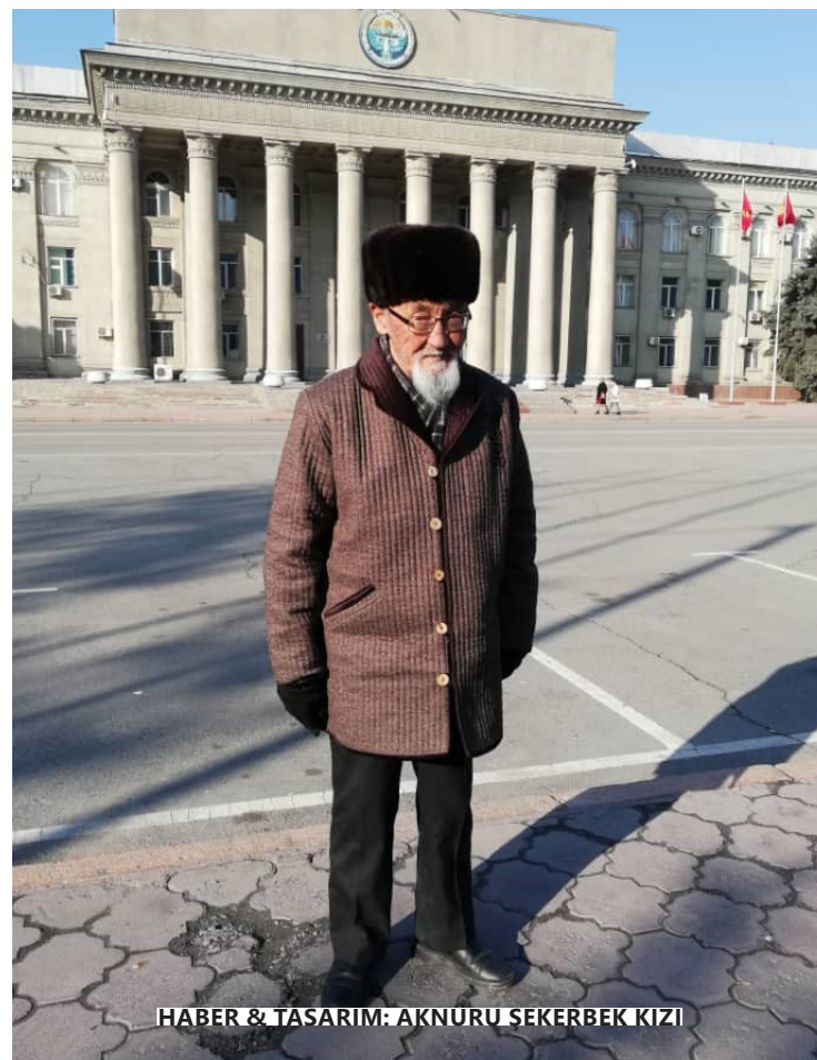
HABER & TASARIM: AKNURU SEKERBEK KIZI