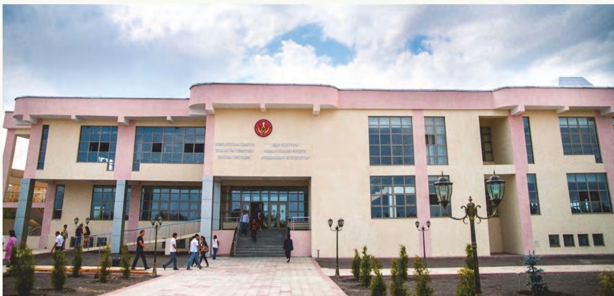
7-таблица. Ашканалар, кантин-кафетерийлер, китепкана/ окуу залы