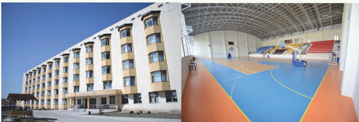
8-таблица. Студенттер үйү