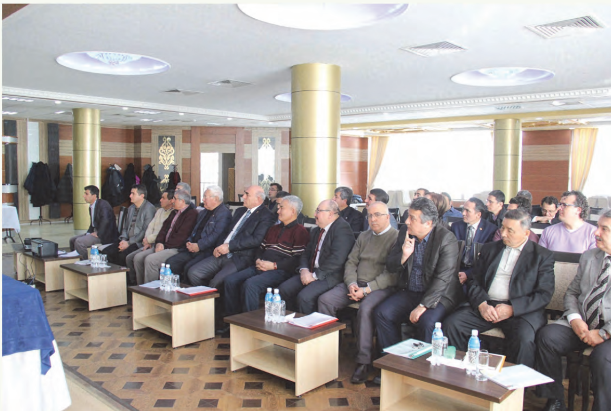
2-таблица. II консультативдик жыйындын жумушчу тобу жана катышуучулары