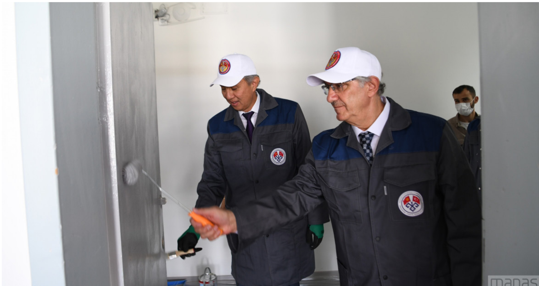
Кабар: MEDIAMANAS Которгон: Бегайым Курманбекова