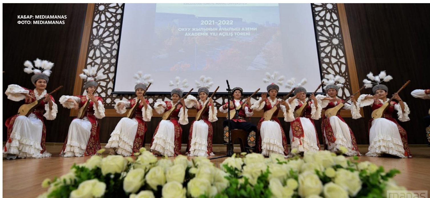
КАБАР: MEDIAMANAS