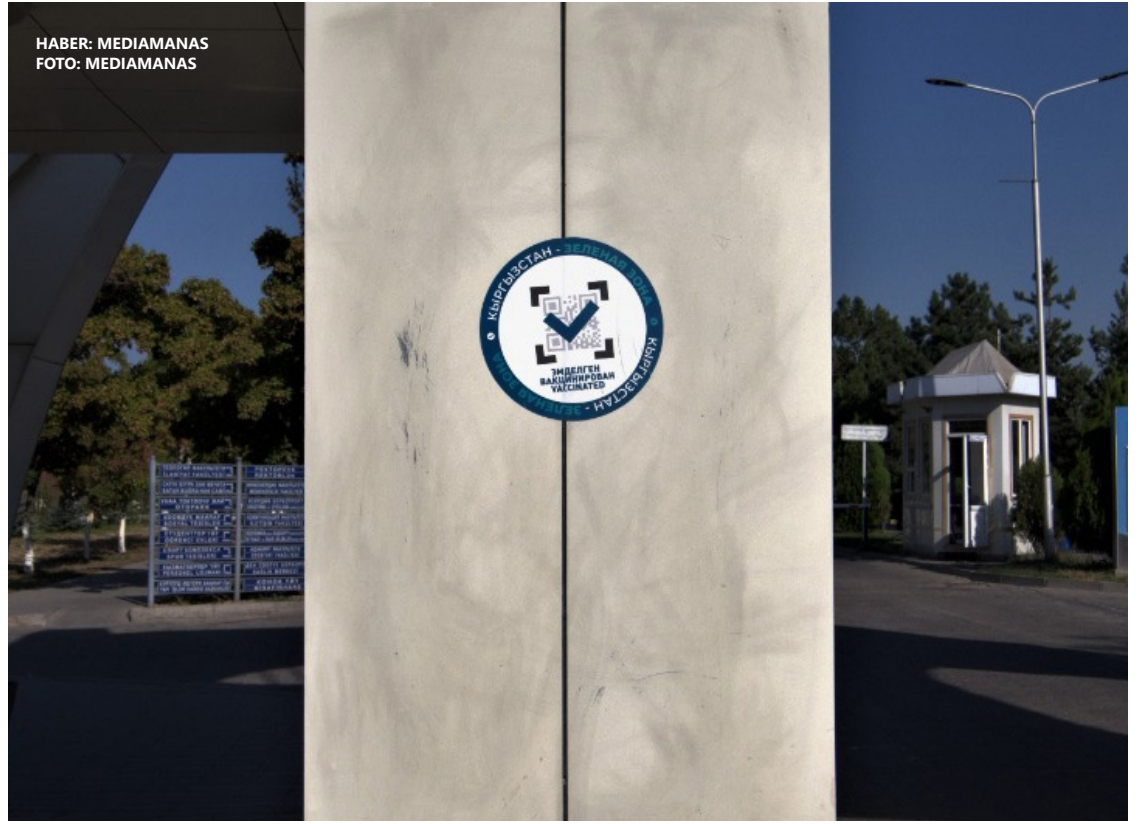
HABER: MEDIAMANAS

KTMÜ, pandeminin başından bu yana COVID-19 ile mücadele hususunda çok etkin çalışıyor. Bugüne kadar KTMÜ mensuplarına COVID-19 ve virüsle mücadele konusunda eğitimler verildi: Üniversitenin bütün alanları sürekli dezenfekte edildi, sosyal mesafeye uyma ve maske kullanımı kurallarına hassasiyetle uyuldu, KTMÜ'nün bütün ülkeye yayın yapan Manas Radyosu ile Manas Televizyonu'nda Kırgızistan Sağlık Bakanlığı ile iş birliği içinde radyo ve televizyon programları yapıldı. MEDIAMANAS'ın yaptığı televizyon programları ülkenin devlet televizyonunda da yayınlandı.