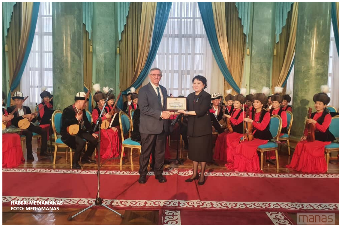
HABER: MEDIAMANAS

Tören Bişkek'te 7-8 Ekim 2021 tarihlerinde düzenlenen "Kazakistan Kültür Günleri" adlı etkinlik kapsamında Kazakistan'ın ve Kırgızistan'ın önemli şahsiyetleri ile sanatçıları ödüllendirmek için düzenlendi.